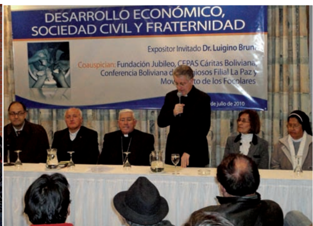
Conferenza sulla Caritas in Veritate a La Paz

Il viaggio in Bolivia è iniziato a Santa Cruz per una scuola EdC organizzata dalla commissione boliviana, ma aperta ad altri Paesi del Sudamerica di lingua spagnola, e con la presenza importante di al-