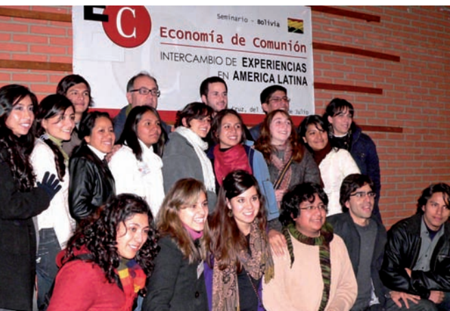
Scuola EdC a Santa Cruz

Gli ultimi giorni sono stato, sempre accompagnato dai responsabili di zona