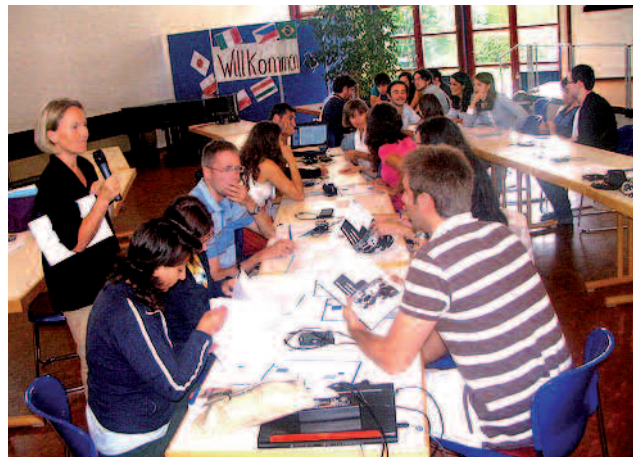
Giovani giuristi a Ottmaring

In Germania. Come oramai avviene da cinque anni, un gruppo di giovani giuristi provenienti da Università di diversi Paesi europei si è riunito a fine luglio. Questa volta nella Cittadella di Ottmaring. Il tema del Seminario incentrato sulla li-