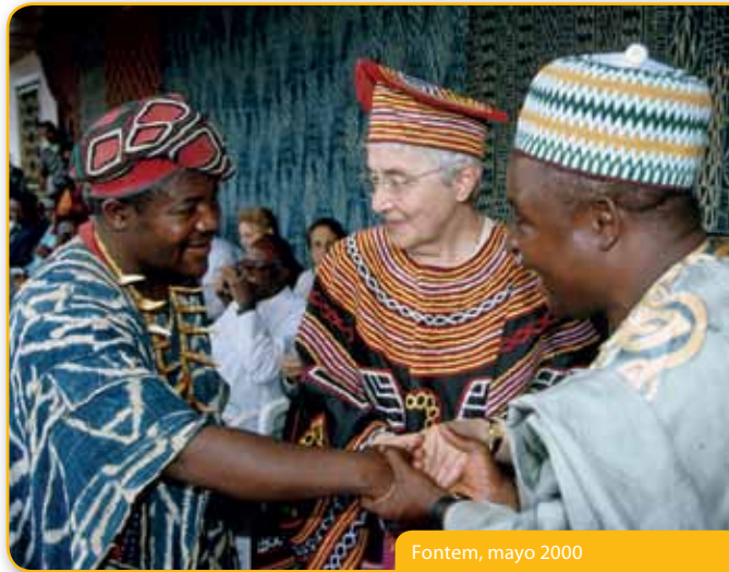
Fontem, mayo 2000

En sintonía con el pensamiento de los Papas y por una intuición que brotaba del amor, Chiara, durante su viaje a Nairobi (Kenia), en mayo de 1992, fundó la Escuela para la Inculturación, inspirada en la Espiritualidad de la Unidad, para dar espacio