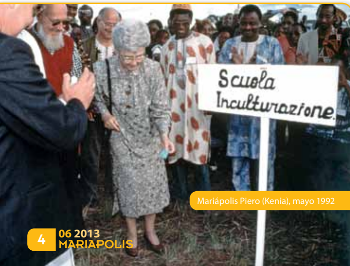
Mariápolis Piero (Kenia), mayo 1992

Se iniciaba así un interesante proceso de descubrir al otro, de inculturación y de interculturación incluso entre las mismas culturas africanas, dadas las especificidades de los distintos grupos étnicos. Con el paso de los años han crecido los frutos de ese hacerse uno más profundo 1 indi-