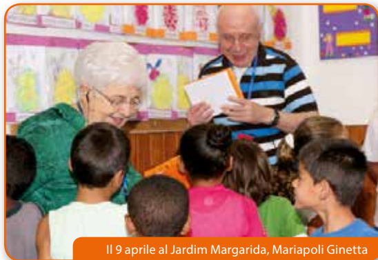
Il 9 aprile al Jardim Margarida, Mariapoli Ginetta