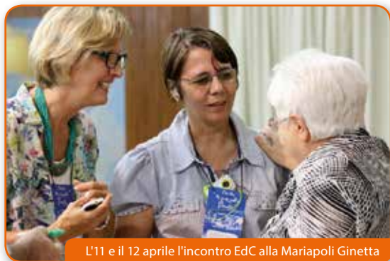
L'11 e il 12 aprile l'incontro EdC alla Mariapoli Ginetta

Emmaus all'incontro con i focolarini invita ad un esame di coscienza lì dove i poveri ci considerano ricchi «si va contro l'uguaglianza sociale che Dio vuole tra i fratelli». «Se guardiamo ai bisogni degli altri – afferma –, ridimensioniamo le nostre pseudo-necessità, siamo più attenti all'uso delle cose che Dio ci dà e a metterle a