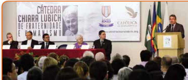
Il 25 marzo, «Cattedra Chiara Lubich» all'Università Cattolica del Pernambuco

profeta porta una realtà nuova da parte di Dio, ma attraversa il deserto delle difficoltà. Questo riempie di sacralità questa esperienza».