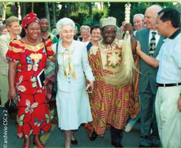
Il Fon Lukas accolto al Centro dell'Opera il 26 settembre 2000

Il 2 aprile il Fon di Fontem, Lukas Njifua, ci ha improvvisamente lasciati per un'embolia polmonare. Si trovava a Yaoundé, capitale del Camerun, dove da alcuni mesi svolgeva il suo lavoro a servizio dello Stato. Già presidente della South West Chiefs Conference, era stato infatti nominato recentemente Senatore.