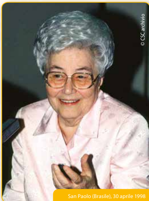
San Paolo (Brasile), 30 aprile 1998

Ora, sin dall'inizio del Movimento, come sappiamo, non si è mai capita la ricerca della santità per se stessa. Poteva esprimere ancora un ripiegamento su di sé.