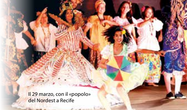
Il 29 marzo, con il «popolo» del Nordest a Recife

Lo si era visto all'incontro dei Vescovi che condividono la spiritualità dell'unità: quante esperienze di comunione da loro vissute all'interno degli organi ecclesiali, nelle loro diocesi! E con quale nuova energia sono ripartiti i molti impegnati in campo politico che stanno facendo della fraternità la legge fondamentale del loro impegno, perché sia autentico servizio al bene comune.