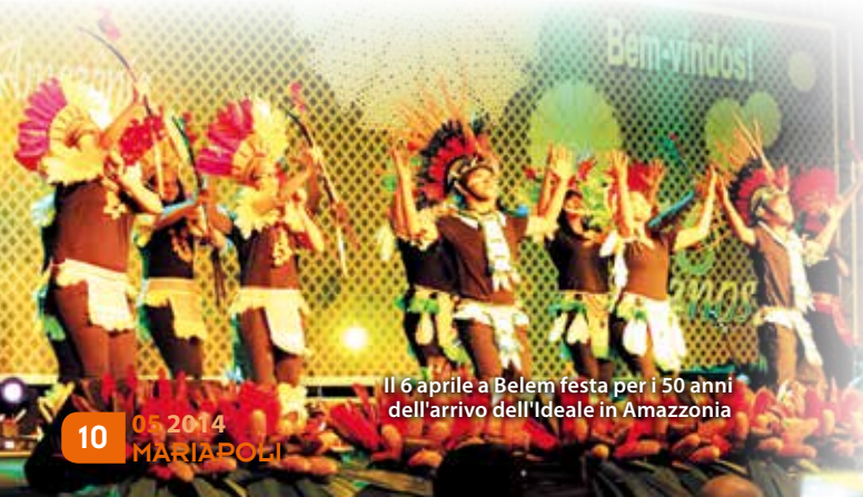
Il 6 aprile a Belem festa per i 50 anni dell'arrivo dell'Ideale in Amazonia