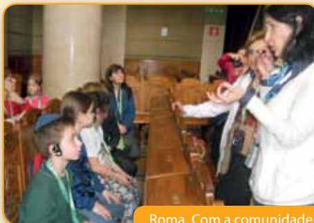
Roma. Com a comunidade hebraica