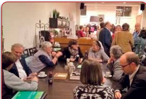
Cidadela Marienkroon. Trabalhos em curso no encontro dos amigos. À esquerda, a porta que se abre, um dos símbolos do evento