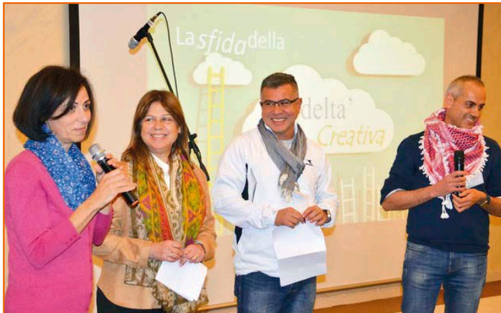
En Amman, Jordania eran 135 de varios países de Oriente Medio.

Gracias a este pequeño esquema común, en los distintos retiros esparcidos en el mundo se ha asistido a una inmensidad de experiencias sencillas y al mismo tiempo