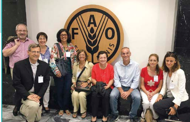
Roma, 8 septiembre 2017. La delegación de los Focolares en la Fao

informados a través de una carta, se están uniendo con mucho entusiasmo. Incluso los Jóvenes por un Mundo Unido han recogido el desafío, incluyéndolo entre las prioridades de su camino de construcción de un mundo unido.