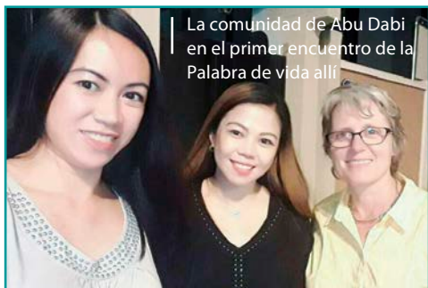
La comunidad de Abu Dabi en el primer encuentro de la Palabra de vida allí

que no conoce distancias, Emmaus». Esta carta es muy valiosa, expresa el secreto de su amor y de su voluntad de resistir.