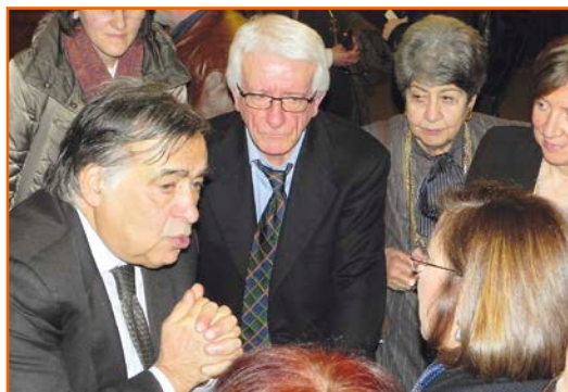
Palermo, 20 enero 2018. El alcalde Leoluca Orlando (a iz.) con personas de los Focolares

Emaús en su carta invitaba a reflexionar sobre los frutos de aquel programa: «Os invito a compartir los muchos fragmentos de fraternidad que, en consonancia con vuestras raíces y con el compromiso de muchos, se han consolidado en estos años».