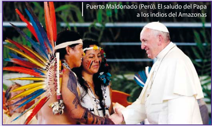
Puerto Maldonado (Perú). El saludo del Papa a los indios del Amazonas

Perú. Un camino nuevo es posible. Un índice de pobreza que superar el 20%, discriminación social de las mujeres, los niños, los ancianos, poblaciones que viven a 4000 metros, prácticamente aisladas; división política y corrupción extendida: estos algunos aspectos del Perú, no solo católico, que esperaba al papa Francisco. Junto a esto, y el pontifice lo ha elogiado muchas veces, una riquísima religiosidad popular, que ha empujado a masas de personas a encontrarse con él, llegadas de las ciudades y sobre todo de las provincias. En esta tierra que Francisco ha definido «Ensanada» (tierra de santos), «caminar», otra palabra clave que nos ha dejado, significa para nosotros encontrar elementos del Verbo para valorizar e incentivar en el mundo andino y en su religiosidad, incluidas las poblaciones amazónicas.