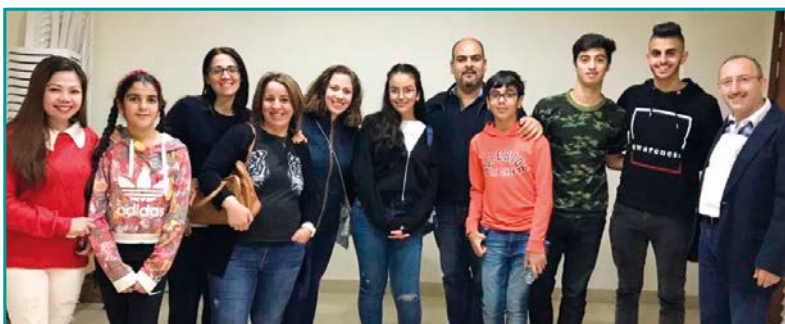
La comunità di Abu Dhabi al primo incontro della Parola di vita sul posto