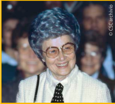
Roma, 20 marzo 1983. Chiara Lubich al PalaEUR

[...] Vivir según la Buena Nueva, desencadenar en el mundo la revolución evangélica equivale a desencadenar también la más potente revolución social. ¿Existen, hoy, desniveles sociales en el mundo? ¿Siguen estando frente a frente ricos y pobres?