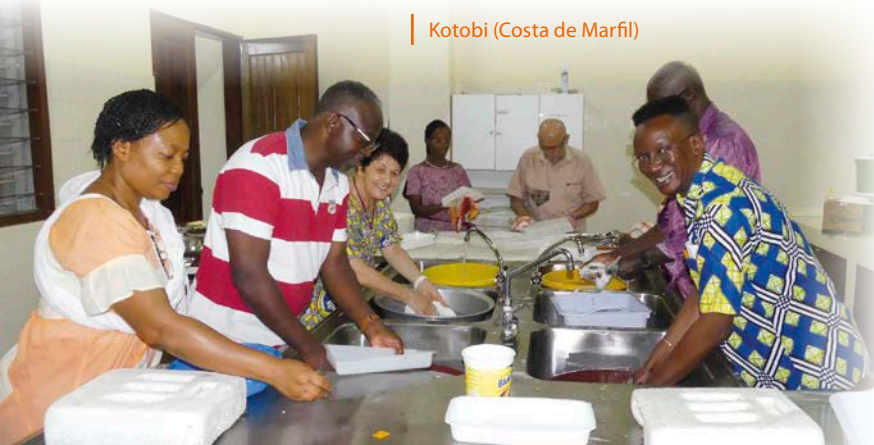
| Kotobi (Costa de Marfil)