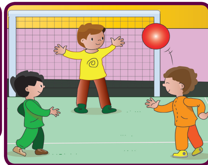
El entiende y no vuelve a hacerlo. Ahora son tres amigos inseparables.