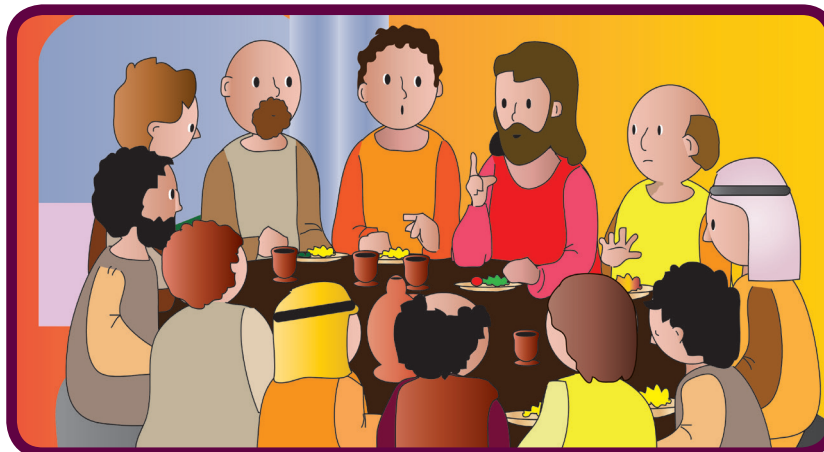
Les dice que dentro de poco los dejará y regresará donde su Padre que está en el cielo, sus discípulos están tristes porque no quieren que se vaya.