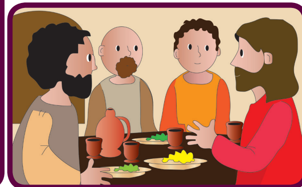
Entonces para ayudarlos, Jesús les dice: "La paz les dejo, mi paz les doy" (Juan 14,27).