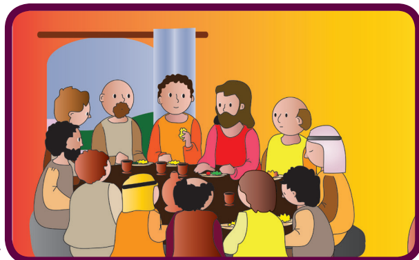
Jesús está con sus discípulos en la última cena.

Busca la paz y anda tras ella. (Salmo 34, 15)