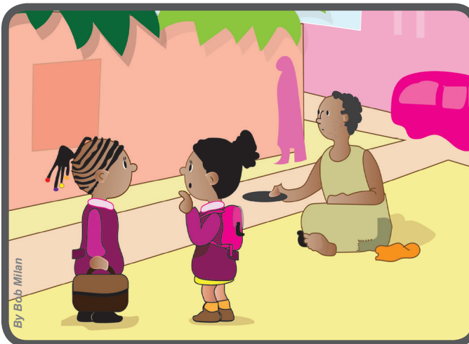
Logo mais na frente, vi um homem pobre. Pensei em lhe dar o dinheiro, mas a minha amiga, que estava comigo, me disse para não dar, para pensar em mim mesma!