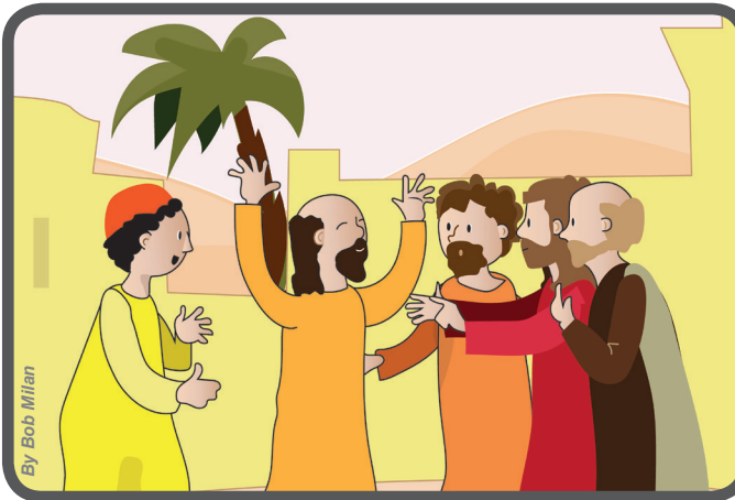
Jesus o cura e as pessoas dizem: nunca se viu algo igual! (Mt 9,32-33).