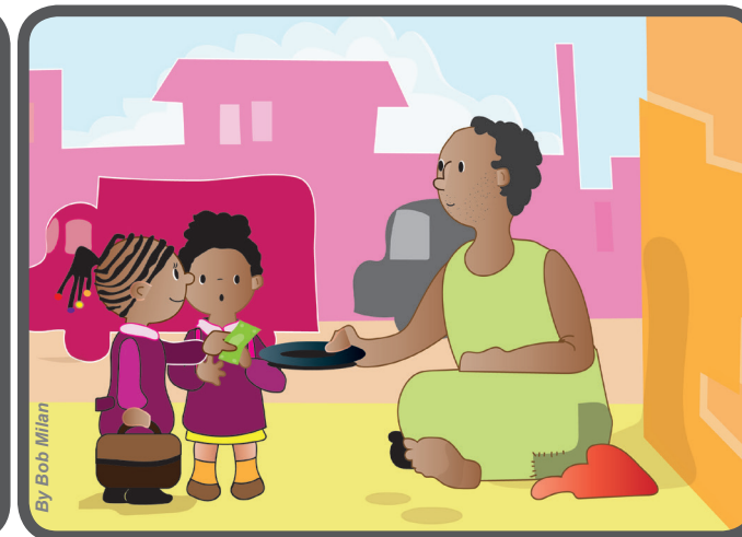
Mas eu pensei: amanhã eu terei o que comer, mas e ele? Então, lhe dei o dinheiro do meu sanduíche e experimentei uma grande alegria no coração».