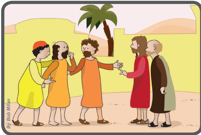
Levam a Jesus um homem mudo.

“De graça recebestes, de graça deveis dar!” (Mt 10,8)