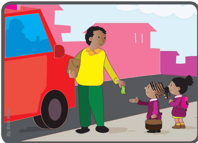
« indo à escola, eu estava mesmo com fome. No caminho, encontrei o meu tio que me deu dinheiro para comprar um sanduíche.

É justamente o que nos conta Vergence, uma menina do Congo: