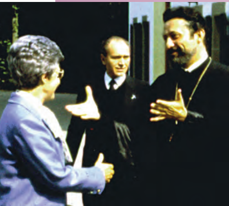
Chambesy 1982. Il Metropolita Damaskinos accoglie Chiara.

Il Movimento dei Focolari partecipa al dolore del Patriarcato ecumenico di Costantinopoli per la dipartita del Metropolita Damaskinos di Adrianopoli, avvenuta lo scorso 5 novembre. Personalità eminente nel mondo ecumenico, era impegnato in numerosi dialoghi interconfessionali ed interreligiosi. Fondò e diresse il Centro ortodosso di Chambésy (Svizzera) voluto dal Patriarca Athenagoras I. Fin dal 1971 fu Segretario generale della Commissione inter-ortodossa per la preparazione del Grande Concilio Pan-Ortodosso e dal 1982 al 2003 primo Metropolita del Patriarcato ecumenico in Svizzera.