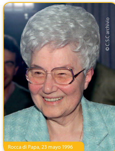
Rocca di Papa, 23 mayo 1996

[...] Pero, no sólo paz. El florecimiento completo, la copa del árbol de nuestra vida interior tiene otros detalles. Por ejemplo: es tal la unión con Dios, que se puede sentir en todos los instantes de nuestra vida. Cuando uno va al fondo del corazón buscando a Dios (en la oración o durante el día), Él, Jesús, está siempre ahí, y lo sentimos con los sentidos del alma. Nos espera allí para escuchar todo lo que le decimos o para decirnos (si sabemos captar su lenguaje silencioso) lo que quiere comunicarnos. Esta perenne presencia de