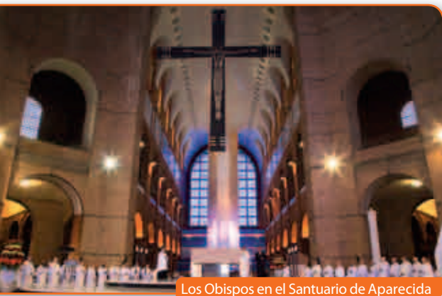
Los Obispos en el Santuario de Aparecida

Se parti3 de un primer don rec3proco, la comuni3n de experiencias sobre el amor