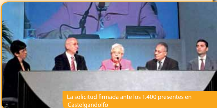
La solicitud firmada ante los 1.400 presentes en Castelgandolfo

Este acto – continuó diciendo Emmaus – nos invita a todos nosotros a comprometernos a vivir «esta santidad día tras día en nuestra vida para contribuir a destacar esa santidad colectiva, santidad de pueblo, a la que Chiara tendía».