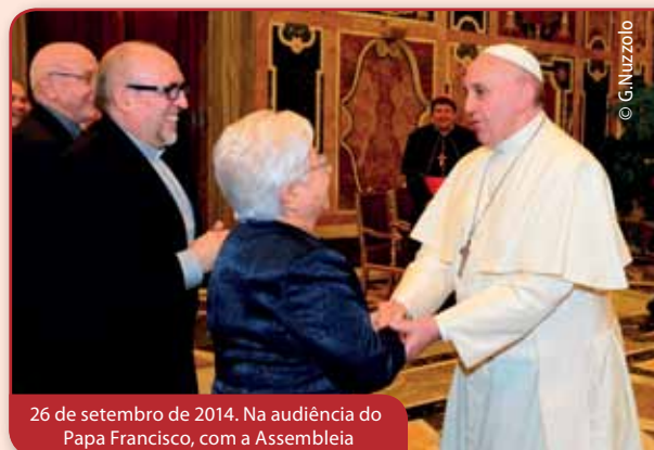
26 de setembro de 2014. Na audiência do Papa Francisco, com a Assembleia

«A Obra vive um momento crucial para o seu futuro. Trata-se de verificar quanto esta primeira geração tenha percebido, realmente, o dom carismático que Deus fez à Igreja e à humanidade, com a pessoa de Chiara. Disto depende o facto de que a encarnação do carisma esteja ao mesmo nível. É um momento de forte e nova autoconsciência