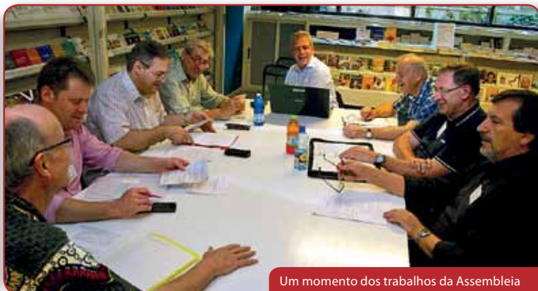
Um momento dos trabalhos da Assembleia

mas somos um». E ela: «Somos quatro, mas somos um!».