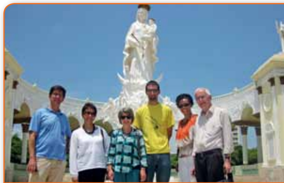
Diante de N a S a de Chiquinquira, em Maracaibo (Venezuela)

«Desde abril – contam-nos da Venezuela – que iniciámos a nova realidade como Zoneta, caracterizada por novos passos de adesão, de abertura de coração e de entendimento, para