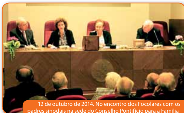
12 de outubro de 2014. No encontro dos Focolares com os padres sinodais na sede do Conselho Pontifício para a Família