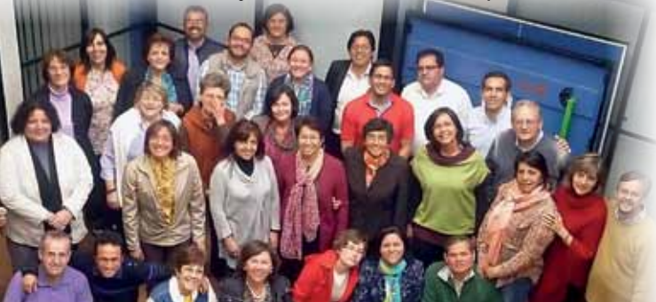
Focolarine e focolarini a Bogotá (Colômbia)

e também com os responsáveis dos outros territórios, procurando compreender o sentido de sermos uma única zoneta para toda a Colômbia, na unidade e na distinção, sendo na totalidade três focolares femininos e um masculino». E é este o desafio: «Trabalhar num projeto único como País, dado que nestes anos havia duas zonetas e um território».