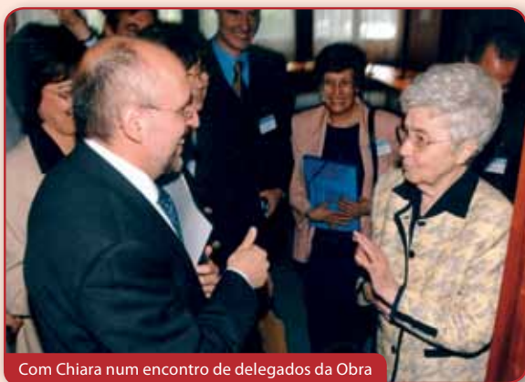
Com Chiara num encontro de delegados da Obra

que procuram Deus e a si mesmos Nele, há muita luz e muita escuridão. No início da minha vida de focolar um grande sofrimento foi constatar os sérios limites da nossa humanidade em viver o Ideal puro. Estava ainda no período de formação e poderei chamá-la como a crise da idealidade, que agora considero ter sido fundamental, no meu caminho espiritual. Para mim foi particularmente forte, dada a minha formação intelectual, com uma certa tendência a idealizar. De facto podia aceitar que fôssemos diferentes em tudo mas não que tivéssemos diferentes ideias sobre a unidade. Outro momento doloroso foi o trabalho na «comissão 1» para o aprofundamento da vocação do focolarino e da focolarina, instituída pela Emmaus em 2011, e portanto a leitura de muitas cartas, das quais emergia um grito lancinante de dor, expressão de uma vida de unidade mal vivida, de verdadeiras deformações do Ideal. Esta chamá-la-ei a crise da realidade.