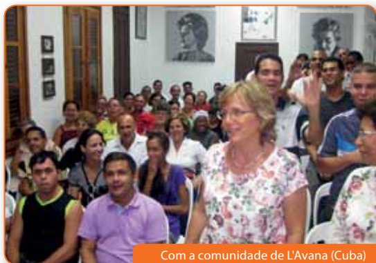
Com a comunidade de L'Avana (Cuba)