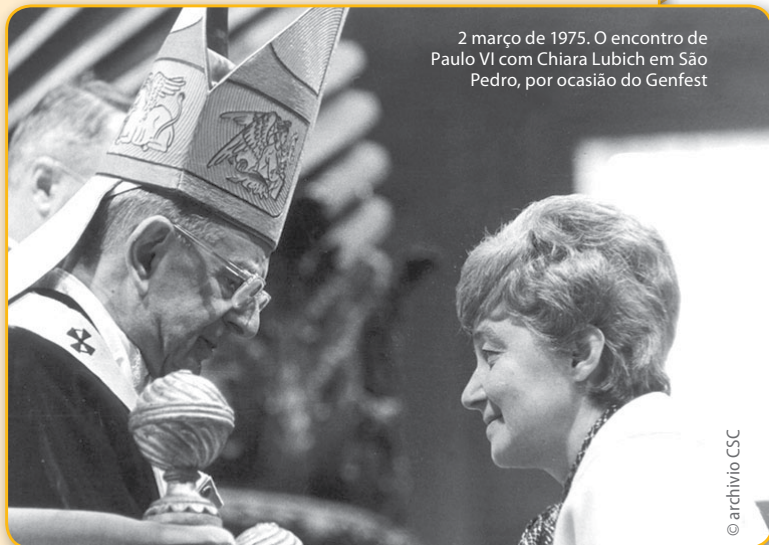
2 março de 1975. O encontro de Paulo VI com Chiara Lubich em São Pedro, por ocasião do Genfest

Nos seus quinze anos de pontificado, recebeu-a também, em audiência privada, cinco vezes. O Papa Montini interessava-se pelo desenvolvimento do Movimento, pela sua difusão e, em particular, pelas modificações necessárias do seu Estatuto. Era preciso adaptá-lo à amplitude de ação, à variedade dos membros que abrangia e sobretudo à natureza do Movimento, que não encontrava correspondência no direito canónico existente. Paulo VI quis tratar disso pessoalmente e, com sabedoria e audácia, contri-