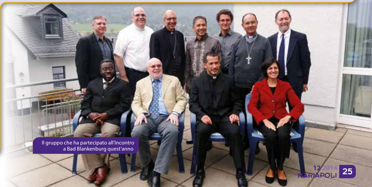
Il gruppo che ha partecipato all'Incontro a Bad Blankenburg quest'anno