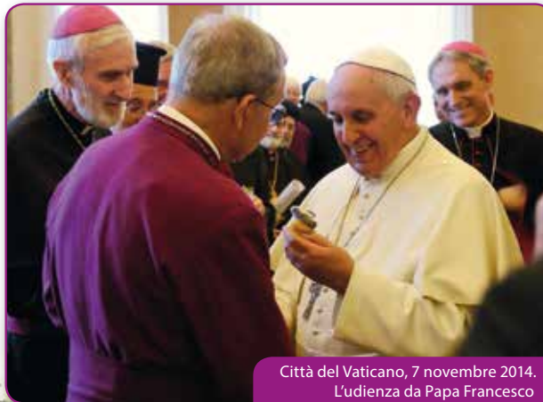
Città del Vaticano, 7 novembre 2014. L'udienza da Papa Francesco