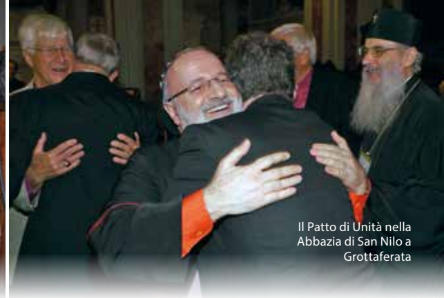
Il Patto di Unità nella Abbazia di San Nilo a Grottaferata