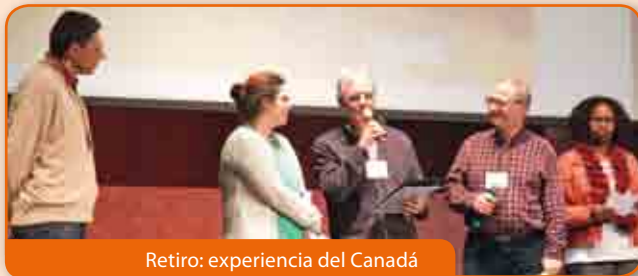
Retiro: experiencia del Canadá

En Chicago surge la alegría de ser instrumento del carisma de la unidad desde los «primeros tiempos» en los años '60 y el entusiasmo de salir una vez más hoy «en misión», con la apertura del nuevo focolar femenino en Denver (Colorado).