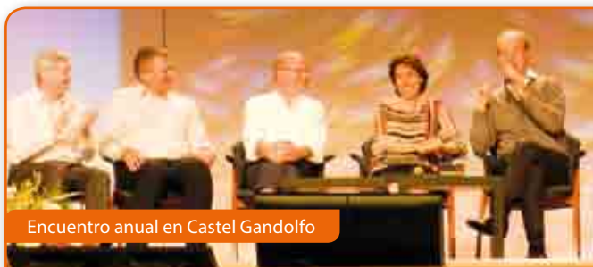
Encuentro anual en Castel Gandolfo

Más de 700 participantes (de los cuales 50 sacerdotes) de diversos países de Europa, de todas las edades. Muchísimas las experiencias de compromiso en los diálogos y en particular en las muchas iniciativas de