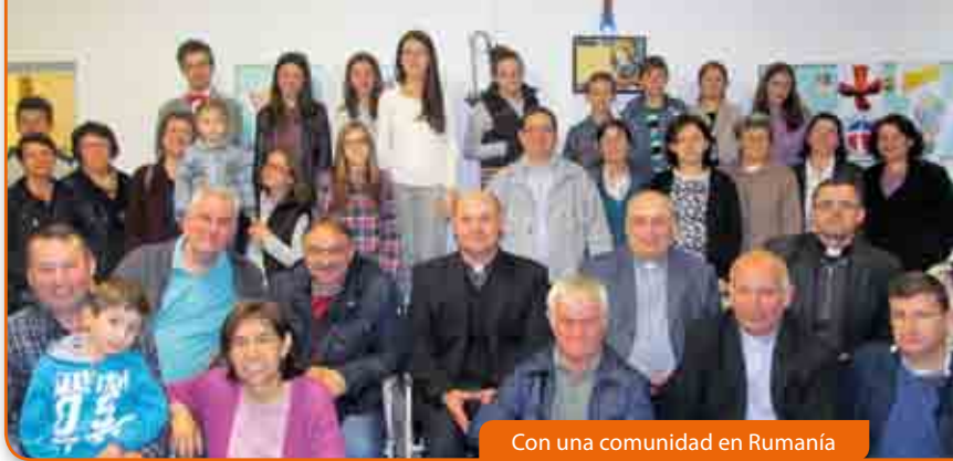
Con una comunidad en Rumanía

Un pueblo abierto, acogedor, profundamente cristiano