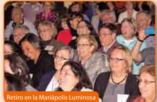
Retiro en la Mariápolis Luminosa

trabaja y que, iluminada del Ideal, sabe suscitar una solidaridad auténtica. Sus experiencias lo confirmaban; como la de una joven con cinco hijos, abandonada de su marido, pero llena de esperanza y sostenida por la comunidad local. De San José, una familia coreana con mucho sacrificio y con el apoyo constante de la comunidad local, ha acogido en custodia a dos niñas huérfanas a causa de una tragedia provo-