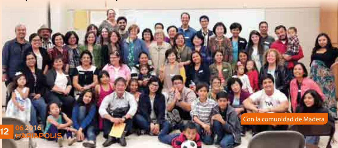
Con la comunidad de Madera

La visita a Maryland era sobre todo para conocer la nueva próxima sede de los dos centros zona, establecidos actualmente en la periferia de Washington.