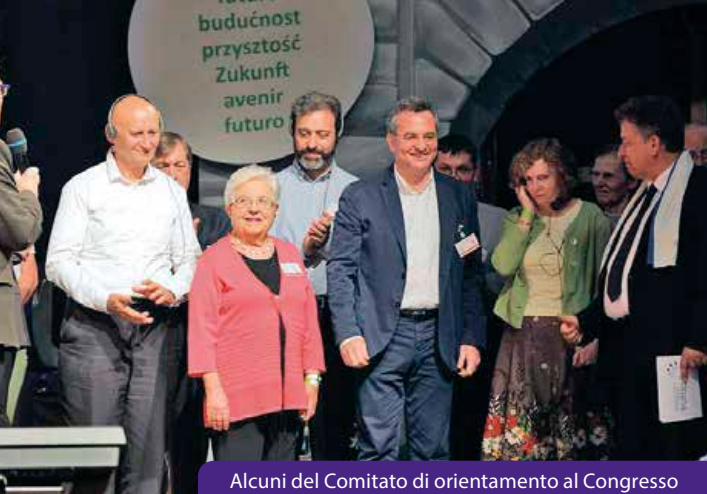
Alcuni del Comitato di orientamento al Congresso