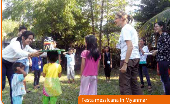
Festa messicana in Myanmar

Et les gen4 de Welwyn Garden City (Grande-Bretagne) ont fait un «voyage»: un train imaginaire qui les a portés à Trente où Chiara a vécu et ensuite en Afrique et en Asie pour découvrir comment l'Idéal de l'unité y est arrivé. Le «train» les a portés ensuite en Terre Sainte pour