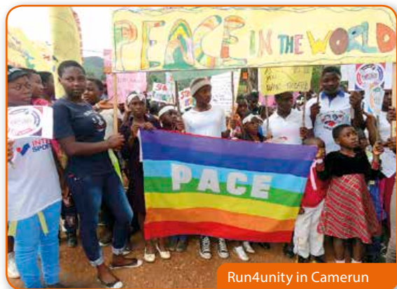
Run4unity in Camerun

Dans les Marche (Italie), on a commencé depuis deux ans à regarder les réalités des jeunes (enfants et adolescents) dans leur ensemble. De telle façon, on s'aide à les porter de l'avant en valorisant