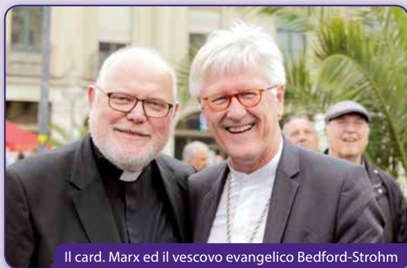
Il card. Marx ed il vescovo evangelico Bedford-Strohm

«d'Ensemble pour l'Europe» a suscité une attention médiatique comme jamais. Et chose curieuse et qui ne coule pas de source en Allemagne: dans aucun des articles, du monde des médias ecclésiastiques ou non, on n'a relevé une parole négative sur l'événement. Gérard Testard d'Efesia a commenté pendant la rencontre d'évaluation du Comité d'orientation internationale: «La manifestation sur la place Stachus était une nouvelle sortie publique. 'Ensemble pour l'Europe' de nos Communautés