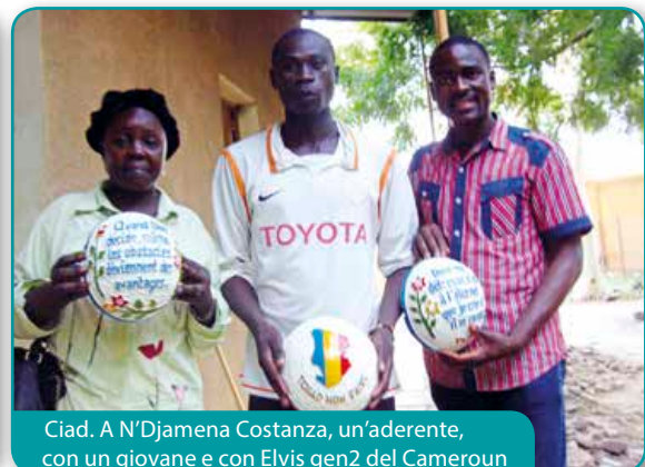
Ciad. A N'Djamena Costanza, un'aderente, con un giovane e con Elvis gen2 del Cameroun