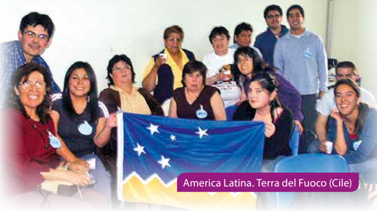
America Latina. Terra del Fuoco (Cile)

de l'utilisation des moyens modernes pour se maintenir en contact. Dans de nombreuses communautés on ressent l'importance de l'appui des prêtres et des religieux de l'Œuvre (Afrique, Brésil et en certaines parties d'Europe) qui créent les occasions pour se rencontrer; ils mettent des locaux à disposition et promeuvent ensemble beaucoup d'activités.