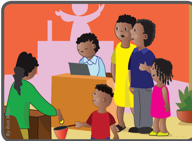
Junto con algunos adultos cantaron durante la misa y pidieron alguna ayuda para estos enfermos.