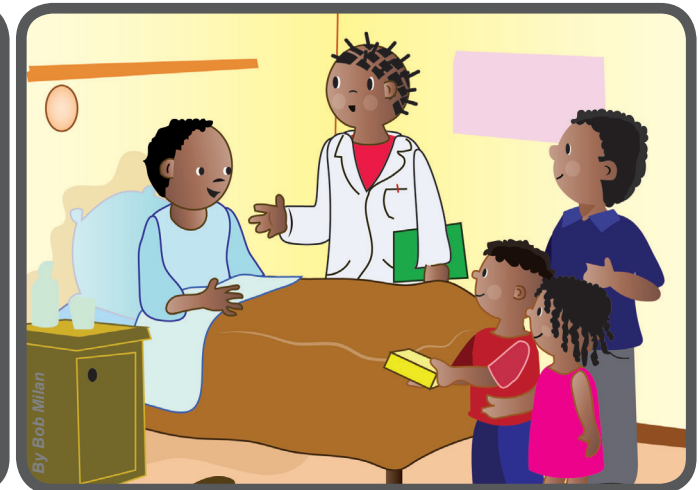
Con lo que juntaron compraron jabón y lo llevaron al hospital para los enfermos que lo necesitan.