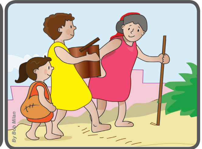
Se le acercan y lo ayudan con mucho amor y paciencia.