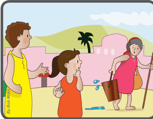
Los tesalonicenses tratan de poner en práctica estas palabras y cuando ven a alguien en necesidad: