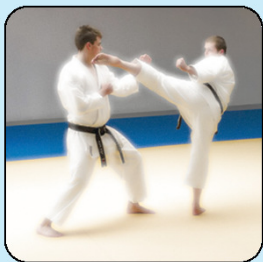
A. C. – ITALIA

Orduan gimnasioko nire lagunak lasaitu nituen eta gazte haiekin hitz egitera joan nintzen. Ez zuela merezi gure kopak lapurtzea eta kopak irabazteko pertsona batek egindako eginahalak eta nekeak errespetatu behar zutela esan nien.