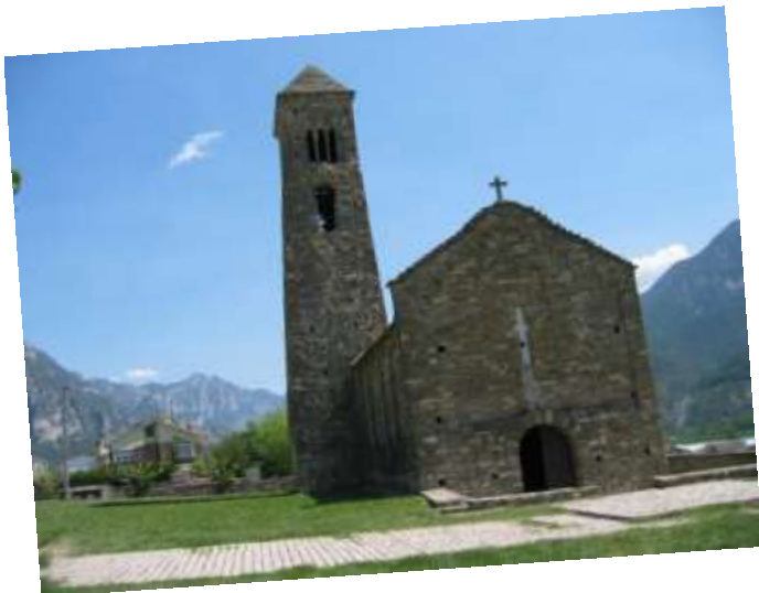
Sant Climent de Coll de Nargó