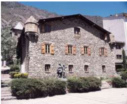
Parlament de Andorra

La Casa de la Vall és l'antiga seu del Consell General (parlament d'Andorra) i està situada al barri antic d'Andorra la Vella. Es tracta d'un edifici del 1580, de planta quadrangular i tres crugies, seguint la tipologia de les masies senyorials catalanes