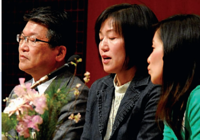
Alcune persone dell'Opera

Inoltre, nella situazione difficile e dura che