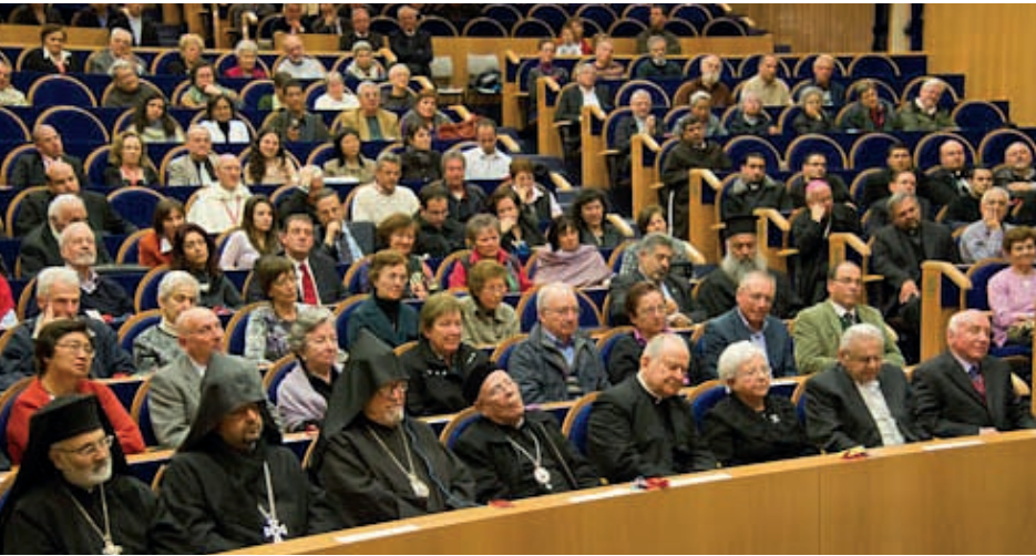
Gerusalemme. Ricevimento per il Consiglio Generale all'Hotel Notre Dame

ri palestinesi da Israele n.d.r. ) che soltanto con l'amore a Gesù Abbandonato si riesce a tollerare.