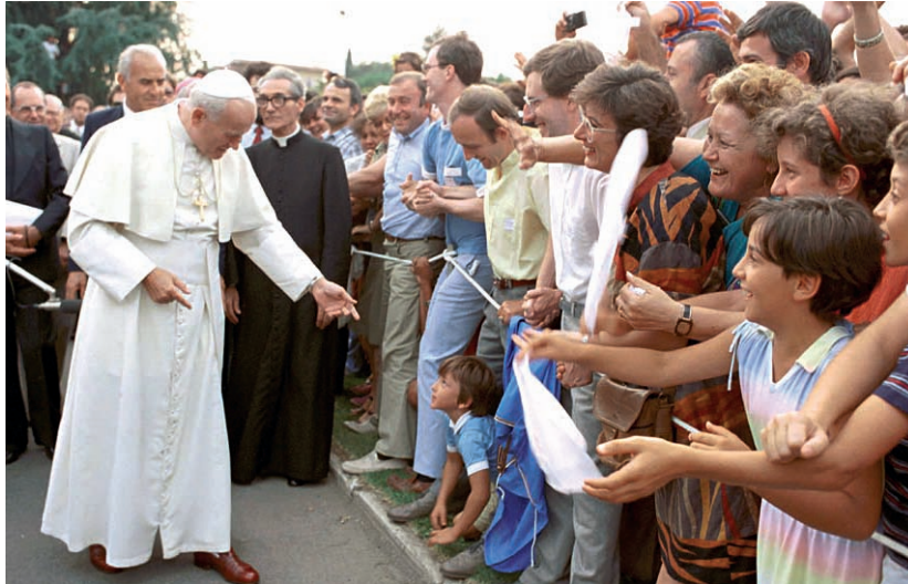
Giovanni Paolo II durante la visita al Centro del Movimento a Rocca di Papa il 19 agosto 1984

Giovanni Paolo II è un Papa che ti ascolta , un Papa attento e sensibile che non si accontenta di una conoscenza superficiale. Forse per questo, come tanti altri, ho avuto il regalo di essere stata più volte invitata