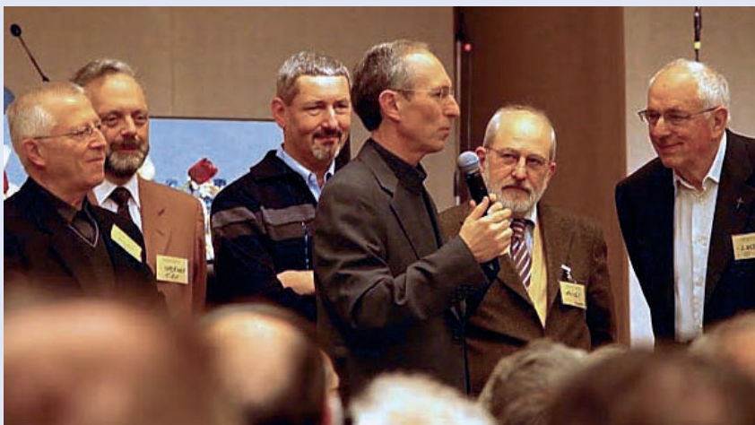
Castel Gandolfo, febbraio 2011. Il nucleo del Centro dei sacerdoti e diaconi volontari

E sono stati così veri giorni di «esercizi spirituali» nella vita ideale: «Abbiamo messo subito in pratica ciò che abbiamo sentito, ad esempio l'ora della verità» che alla fine si è