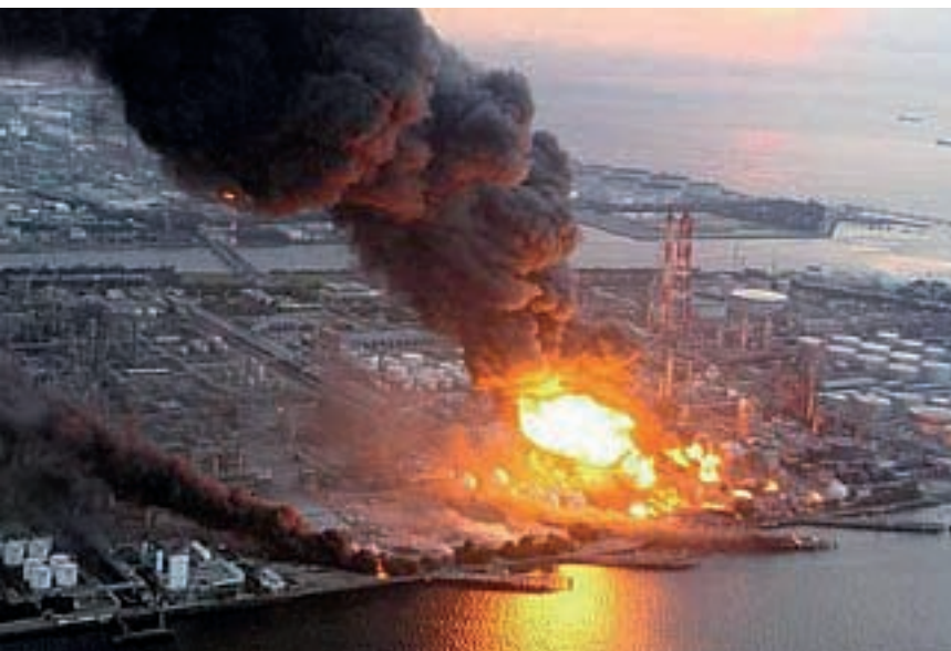
La terribile esplosione alla centrale nucleare di Fukushima

Tutto il mondo è in trepidazione per quanto sta avvenendo in Giappone dopo il terremoto dell'11 marzo, seguito dal devastante tsunami . Oltre ventimila il bilancio provvisorio delle vittime e dei dispersi, intere città spazzate via ed il danneggiamento delle centrali nucleari di Fukushima. Emmaus ha inviato un messaggio alla comunità dei Focolari del Giappone. Dalla zona sono giunte alcune notizie di come si stanno vivendo questi momenti.