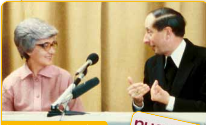
Il vescovo Klaus Hemmerle con Chiara

Dall'introduzione: «Nella luce del carisma dell'unità, Hemmerle matura come teologo e come vescovo una profonda sensibilità ecumenica che dà luogo non solo ad eventi e incontri particolarmente significativi, ma anche ad un pensiero radicalmente nuovo e ad una metodologia in campo ecumenico che hanno come radici i cardini della spiritualità di Chiara Lubich: la Parola, Gesù in mezzo, l'Unità, Gesù abbandonato, Maria. Questo studio intende mettere in rilievo tali punti nodali, che vengono letti in riferimento al particolare stile ecumenico di Hemmerle, al suo pensiero, e alla pionieristica esperienza dei convegni ecumenici di vescovi amici del Movimento dei focolari, dove i vescovi delle diverse chiese effettuano il patto dell'amore reciproco promettendo di "amare la chiesa dell'altro come la propria"».