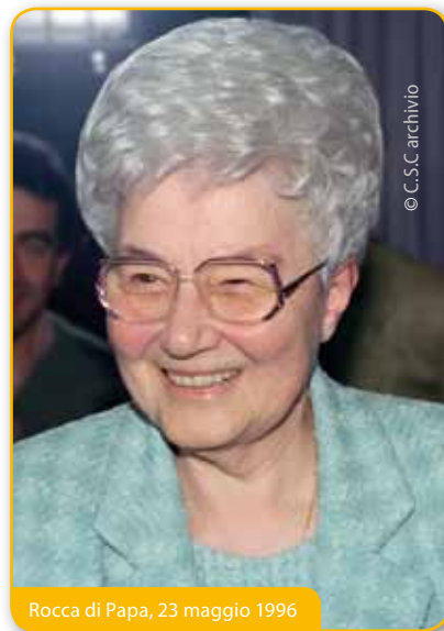
Rocca di Papa, 23 maggio 1996

[...] Ma, non solo pace. La fioritura completa, la chioma dell'albero della nostra vita interiore ha altri particolari. Per esempio: l'unione con Dio è tale da poterla avvertire in ogni istante della nostra vita. Quando si va in fondo al cuore, in cerca di Dio (nella preghiera o durante la giornata) Egli, Gesù, è sempre lì e Lo si avverte coi sensi dell'anima. È lì che ci attende, per ascoltare quanto noi Gli diciamo e per dirci (se sappiamo afferrare il suo linguaggio silenzioso) quanto Egli vuole comunicarci. Questa perenne presenza di