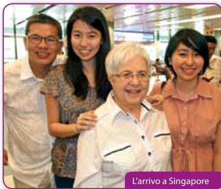
L'arrivo a Singapore

'93. A 20 anni di distanza Dio continua ad operare.