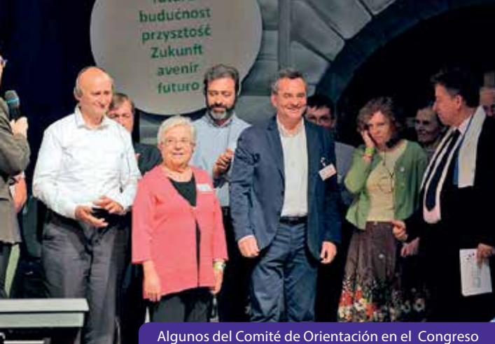
Algunos del Comité de Orientación en el Congreso

unidad, en vosotros la unidad está ante mí».