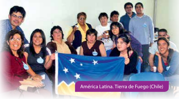
América Latina. Tierra de Fuego (Chile)

Numerosas las experiencias de la utilización de los medios modernos para estar en contacto. En muchas comunidades se siente la importancia de apoyar a los religiosos y a los sacerdotes de la Obra (África, ciertas partes de Europa, Brasil) que crean oportunidades para encontrarse, tienen locales adecuados que ponen a disposición, promueven juntos muchas actividades.