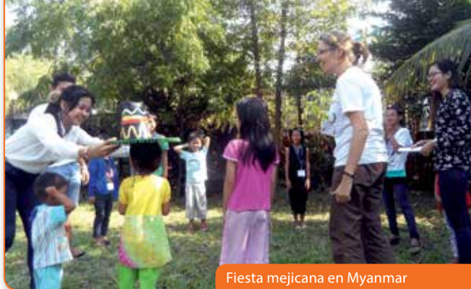
Fiesta mejicana en Myanmar

Y también han hecho un «viaje» los y las gen4 de Welwyn Garden City (Gran Bretaña): Un tren imaginario los ha llevado a Trento donde ha vivido Chiara, después a África y a Asia para descubrir cómo ha llegado allí el Ideal de la Unidad y después, para conocer