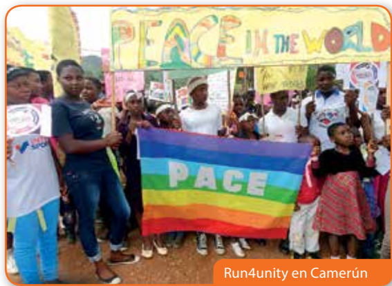
Run4unity en Camerún

En las Marcas (Italia) hace dos años que se ha comenzado a mirar la realidad juvenil (niños y muchachos) en su conjunto. De esta forma se ayudan a llevarlos adelante, dando valor a lo que se hace en las comunidades e implicando