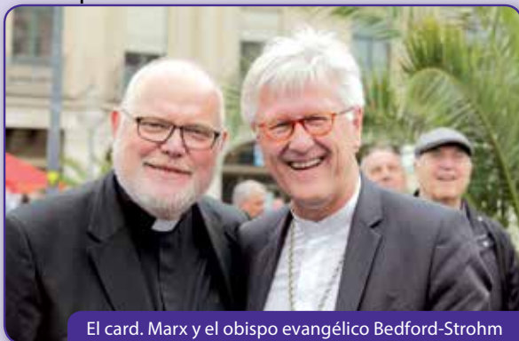
El card. Marx y el obispo evangélico Bedford-Strohm

Testard de Efesia, durante el encuentro de valoración del Comité de Orientación Internacional comentó: «La manifestación en la plaza Stachus era una nueva salida