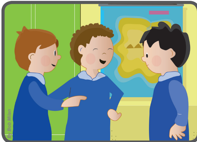
En la guardería algunos niños me hacen bromas porque soy gordito. A mi me molesta mucho que bromeen conmigo, y algunas veces me hacen llorar.