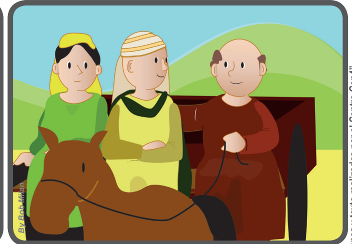
No esperar mañana para perdonarlo, sino, hacerlo enseguida.