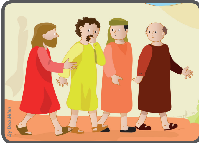
Jesús le dice a sus discípulos que un día Él regresará.

“Por eso estén despiertos, porque no saben en qué día vendrá su Señor.” (Mateo 24,42)