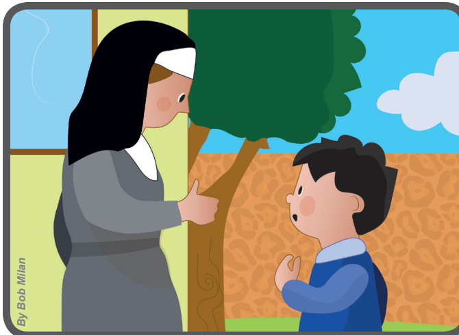
Entonces fui a hablar con la maestra que es una monja, y en vez de acusarlos, le explique el dolor que sentía.