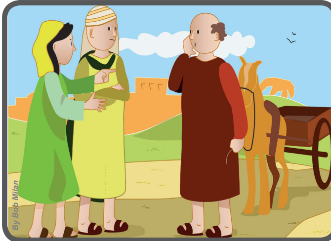
Y los invita a estar atentos y no perder las ocasiones para perdonar: por ejemplo si alguien nos ofende...