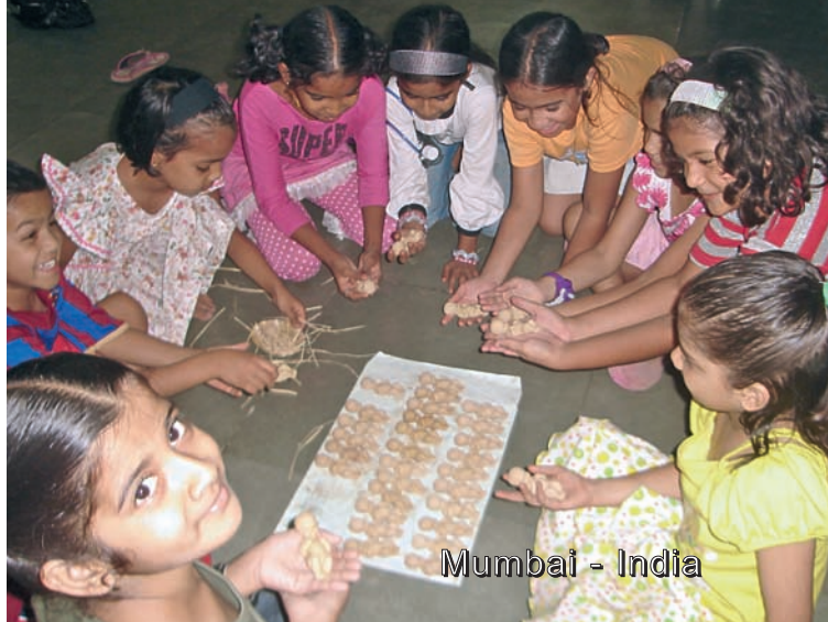
Mumbai - India

Le gen4 sono sempre più coscienti della possibilità di essere «mamme di Gesù» facendolo nascere spiritualmente dovunque. Già avevano sperimentato che Gesù in mezzo tocca i cuori: il sacerdote che ha permesso di offrire le statuette davanti alla sua chiesa ne ha prese 30, lasciando una bella somma per i nostri poveri.