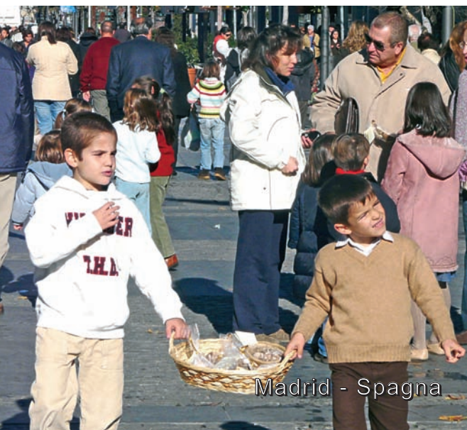
Madrid - Spagna

Un momento indimenticabile l'incontro con il presidente dell'aeroporto, il direttore generale ed il responsabile degli affari