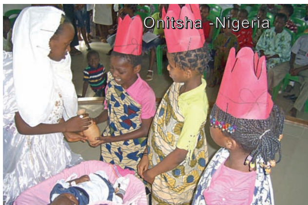
Onitsha - Nigeria