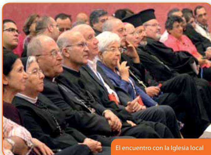
El encuentro con la Iglesia local

gar hasta las raíces que nos hacen descubrir juntos que tenemos mucho en común».