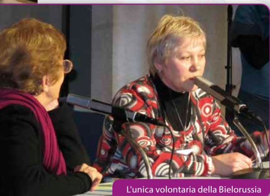
L'unica volontaria della Bielorussia

est une «contamination» que l'amour réciproque opère; une sorte de virus qui attire spontanément les personnes par ceux qui le vivent, comme cela se produisait à Trente avec les premières focolarines. C'est ce qui arrive encore aujourd'hui, souligne Emmaüs: «Le premier fruit de l'amour réciproque vrai est la présence de Jésus au milieu; c'est Lui qui donne le goût, la saveur, la joie, le dynamisme. La vie de noyau devient alors une vie pleine, une vie dans laquelle nous nous communiquons vraiment ce que nous avons de plus profond, dans laquelle nous nous aidons à aller de l'avant. [...] Et en même temps, il arrive que cet amour réciproque contamine, irradie, illumine le milieu environnant; [...] il arrive inévitablement que des personnes s'approchent, demandent; et alors une cellule locale transforme les relations dans un hôpital, dans une école; d'autres personnes sont attirées; commence le monde d'Humanité Nouvelle, commence «l'inondation», pourquoi? Parce que quelques-uns ont commencé à s'aimer réciproquement. Vous comprenez que c'est grandiose ce Commandement Nouveau!».