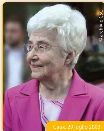
Caux, 29 luglio 2003