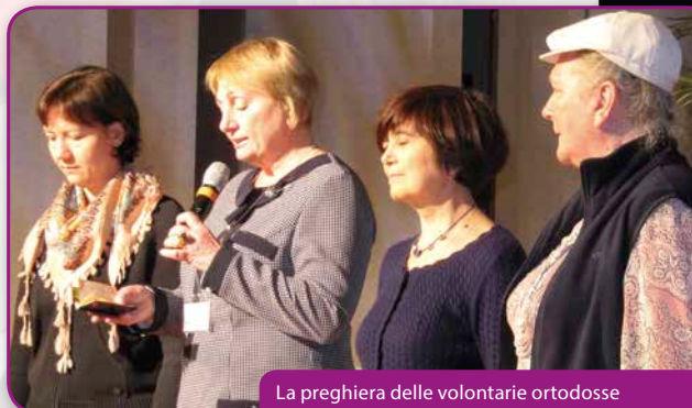
La preghiera delle volontarie ortodosse

que je veux vivre et qui suis dans un milieu où je peux témoigner cet amour. Utilise-moi aussi, famille-focolare qui me trouve dans cette situation, dans ce pays où il n'y a personne. Utilise-moi aussi, noyau de volontaires qui sommes dans ce milieu particulier, difficile, avec tant de contradictions, utilise-nous pour porter cette vie là-bas; utilise-moi, utilise-moi, utilise-moi. Si nous disons toutes à Dieu: «Utilise-moi», vous comprenez que c'est une richesse dans l'Oeuvre en tant que telle et alors la nouvelle configuration devient de nouvelles semilles – c'est pour cela que nous parlons de «nouvelles semilles». Elle devient un nouveau départ, une nouvelle