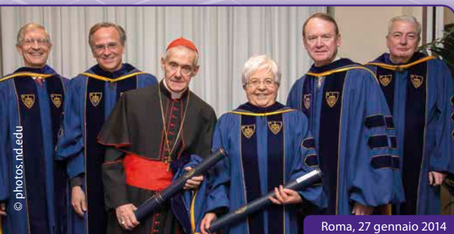
Roma, 27 gennaio 2014