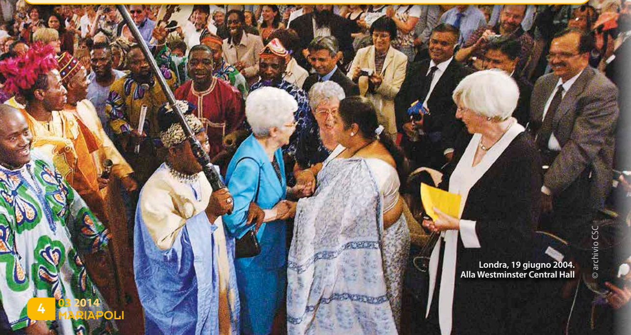
Londra, 19 giugno 2004. Alla Westminster Central Hall