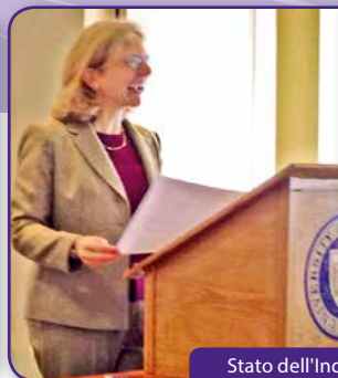
Stato dell'Indiana, 27 gennaio 2014