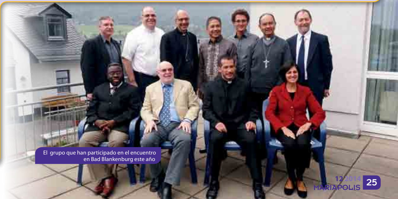
El grupo que han participado en el encuentro en Bad Blankenburg este año