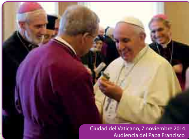
Ciudad del Vaticano, 7 noviembre 2014. Audiencia del Papa Francisco

La urgencia del testimonio de fraternidad y de unidad entre los cristianos se hace patente en el momento más esperado: la audiencia especial con el Papa Francisco. Tres obispos de distintas Iglesias le dirigen unas palabras de saludo, a las que el obispo de Roma responde entre otras cosas: " Esta fraternidad es un signo luminoso y atractivo de nuestra fe en Cristo resucitado. En efecto, si queremos, como cristianos, responder de manera contundente a los dramas de nuestro tiempo y a tantas problemáticas, es necesario hablar y actuar como hermanos, y de manera tal que todos lo puedan reconocer fácilmente ". Y como «hermano» entre los hermanos se dirige a cada uno para intercambiar una palabra y saludarlos personalmente. "Si el ministerio petrino se vive como lo veo en el Papa Francisco, podría haber llegado la hora