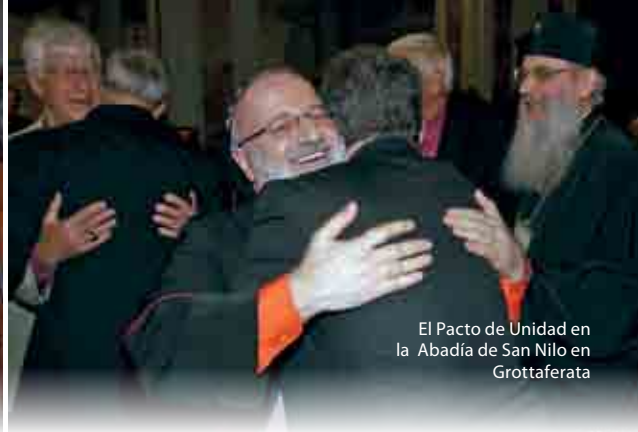
El Pacto de Unidad en la Abadía de San Nilo en Grottaferata