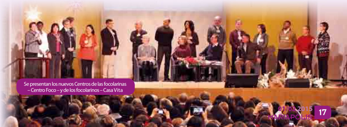
Se presentan los nuevos Centros de las focolarinas - Centro Foco - y de los focolarinos - Casa Vita

Agnes: «Nuestro programa para estos seis años nos lo ha dado la Asamblea de la sección. Con todo el equipo veremos cómo concretar los resultados de la Asamblea, entre ellos la