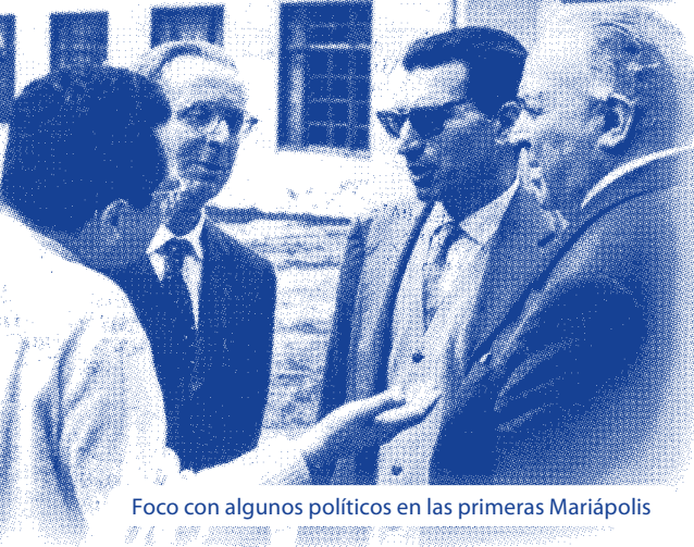
Foco con algunos políticos en las primeras Mariápolis

No basta el desapego de nosotros mismos para ser cristianos. Hoy los tiempos demandan al seguidor de Cristo algo más: una conciencia social del cristianismo, que edifique, no solo la propia tierra según la ley de Cristo, sino que ayude también a la edificación de la tierra de los otros con el gesto universal de la Iglesia, con el ojo sobrenatural que nos da Dios Padre, que desde el cielo ve las cosas de distinta forma que nosotros. Hay que vivir el Cuerpo Místico de Cristo de modo tan excelente que se pueda traducir en cuerpo místico social"