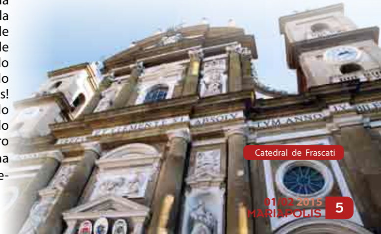
Catedral de Frascati

Ahora nosotros, que hemos recibido de ella el don del Ideal, somos responsables de vivir esta unidad que trae la "presencia de Jesús en medio" en la sociedad de hoy. Me deseo a mi misma y a cada uno de los que pertenecen a la Obra que podamos ser hijos dignos de tal madre.