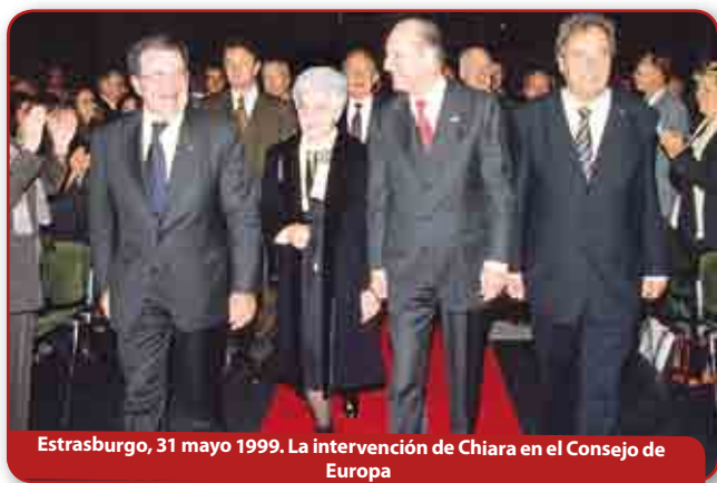
Estrasburgo, 31 mayo 1999. La intervención de Chiara en el Consejo de Europa

nciendo fiel a sus auténticos ideales, el político de la unidad ama a todos, como se ha dicho, y por tanto en todas las circunstancias busca lo que une. Queremos hoy pensar en la política – ya se ha dicho de otra forma – como quizás no se ha concebido nunca: hacer nacer – pase el atrevimiento – una política de Jesús, la que Él piensa y a la que puede dar vida a través de nosotros allí donde estamos: en los parlamentos nacionales y regionales, en los consejos municipales, en los partidos, en los distintos grupos de iniciativa cívica y política, en el gobierno y en la oposición. La unidad, así vivida entre nosotros hay que llevarla después, como levadura, al interior de nuestros propios partidos, a los otros partidos, a las instituciones, a todos los ámbitos de la vida pública, a las relaciones entre los estados".