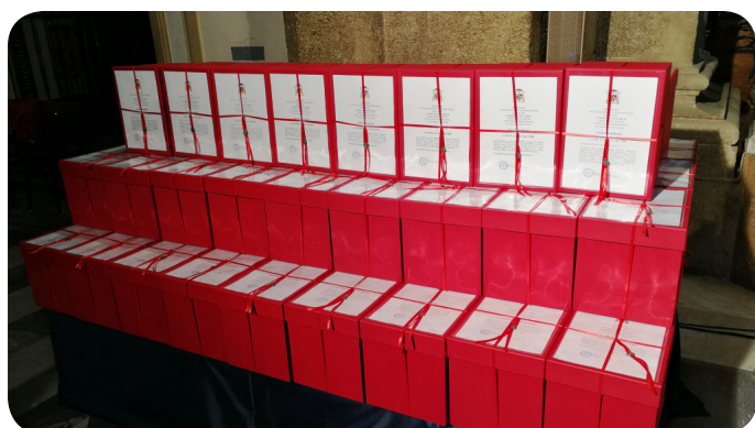
Las 75 cajas