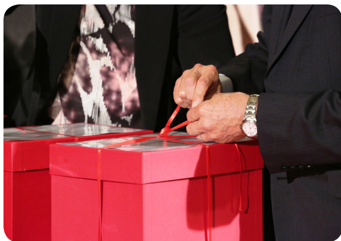
Cierre de las cajas